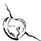
v tvare bubliny a hviezdčky