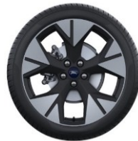
19" disky z ľahkej zliatiny Voliteľná výbava D2VCA