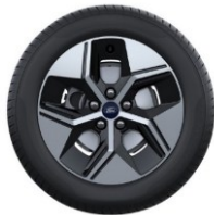
17" disky z ľahkej zliatiny Sériová výbava pre Gen-E