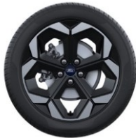
18" disky z ľahkej zliatiny Sériová výbava pre Premium