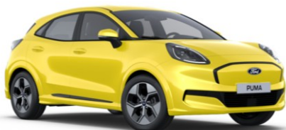
Electric Yellow metalická

● štandardná výbava — nie je k dispozícii dostupné v pakete