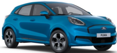
Digital Aqua Blue metalická