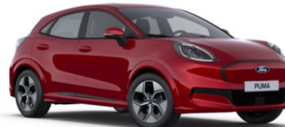
Fantastic Red metalická