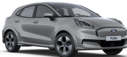
Solar Silver metalická