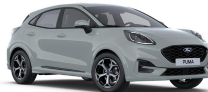
Cactus Gray nemetalická ilustračný obrázok - model Puma 1.0 EcoBoost