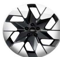
20" zliatinové disky šedá Magnetic sériová výbava pre Premium