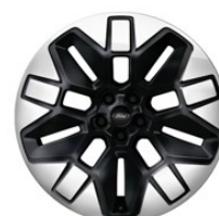
21" zliatinové disky čierna Absolute Voliteľné pre Select/Premium (D2GCX)