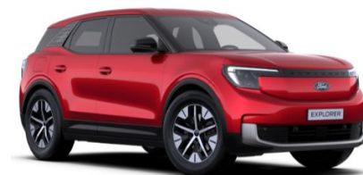
Lucid Red prémiová metalická