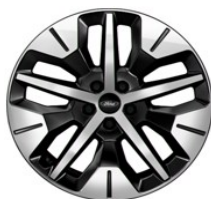
19" zliatinové disky čierna Absolute sériová výbava pre Select Voliteľné pre Style (D2GDA)