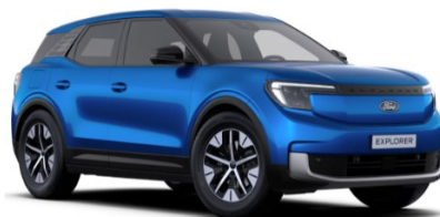
Blue My Mind prémiová metalická