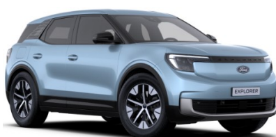
Arctic Blue metalická