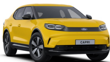
Vivid Yellow nemetalická