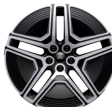
20" zliatinové disky šedá Magnetic sériová výbava pre Premium