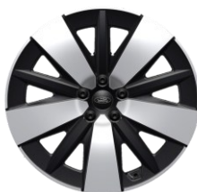
19" zliatinové disky čierna Absolute sériová výbava pre Select Voliteľné pre Style D2GDC