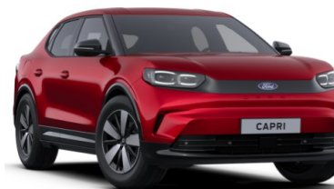
Lucid Red prémiová metalická