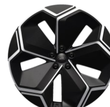
21" zliatinové disky čierna Asphalt Matt Voliteľné pre Select/Premium D2GCY