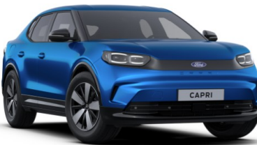
Blue My Mind prémiová metalická