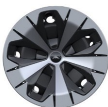
19" oceleové disky s celoplošnými aero. krytmi sériová výbava pre Style