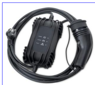
Štandardný kábel pre zapojenie do domácej 230V zásuvky 98 467 444 80