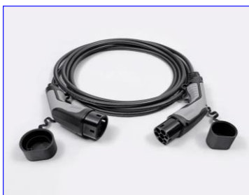
Kábel režimu 3 pre pripojenie do nabíjacej stanice (domáceho WallBoxu alebo verejnej stanice)