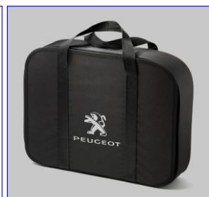
Taška na nabíjacie káble Peugeot 98 493 006 80