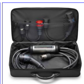
Súprava s nabíjacou jednotkou pre zapojenie do viacerých druhov elektrickej siete (230V/400V/WallBox) 98 460 313 80