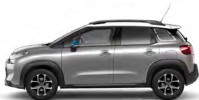
SIVÁ ARTENSE (M)