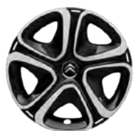
Okrasný kryt STEEL & STYLE 3D 16"