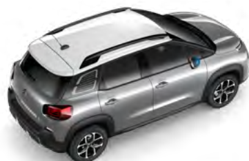
Bielá NATURAL (1)