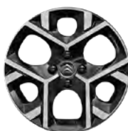
Disk z ľahkej zliatiny ORIGAMI 17" s výbrusom