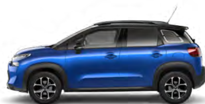
MODRÁ VOLTAIC (M)