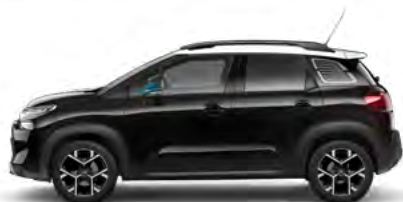
ČIERNÁ PERLA NERA (M)