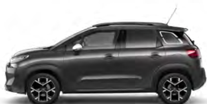
SIVÁ PLATINUM (M)