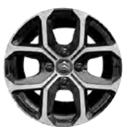
Disk z ľahkej zliatiny X CROSS 16" s výbrusom