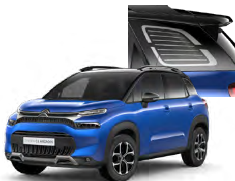
PACK COLOR - ČIERNY