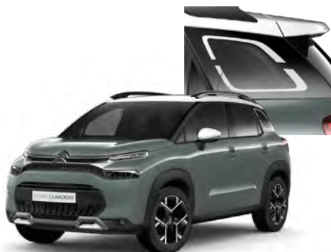
PACK COLOR - BIELY