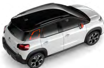
Čierna PERLA NERA