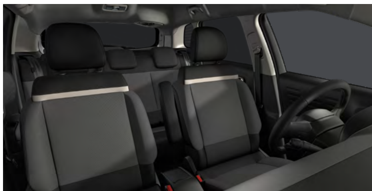
ŠTANDARDNÝ INTERIÉR (4YFT)