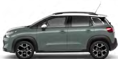
SIVÁ KAKI (1)