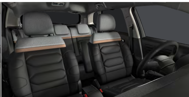
METROPOLITAN GRAPHITE (1QFX)