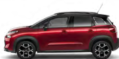
ČERVENÁ PEPERONCINO (M)