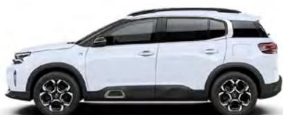
BIELA OKENITE (M)