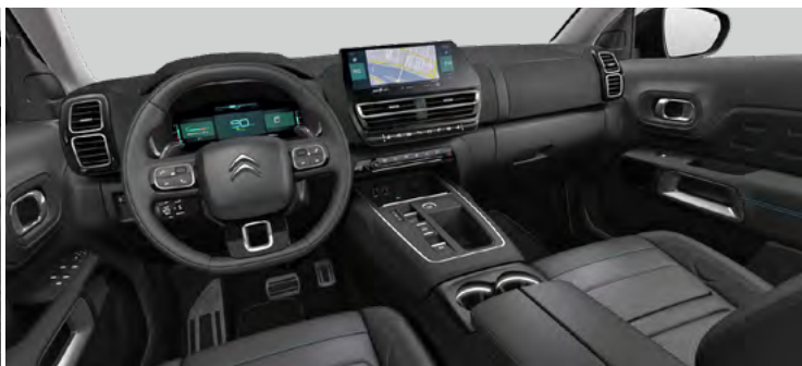
INTERIÉR HYPE BLACK