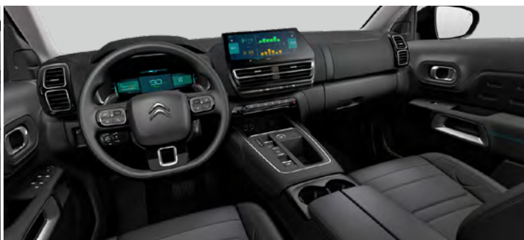
INTERIÉR METROPOLITAN BLACK (v sérii pre PLUS)