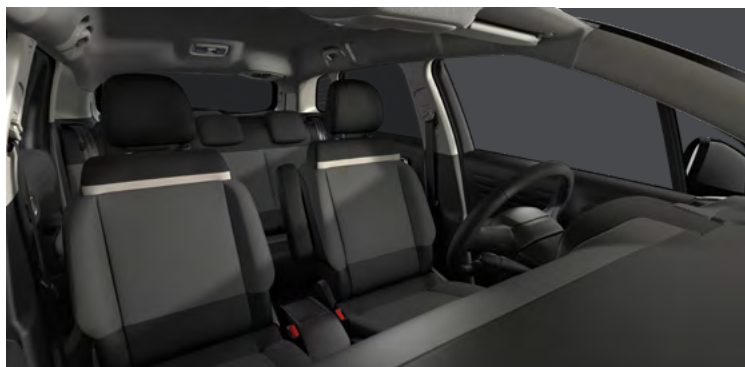
ŠTANDARDNÝ INTERIÉR (4YFT)