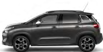
SIVÁ PLATINUM (M)